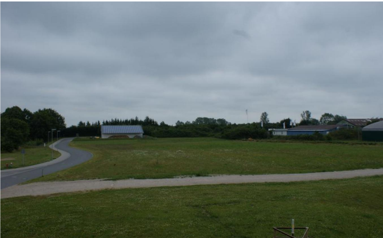
Grundstücksansicht Süderbrarup 1